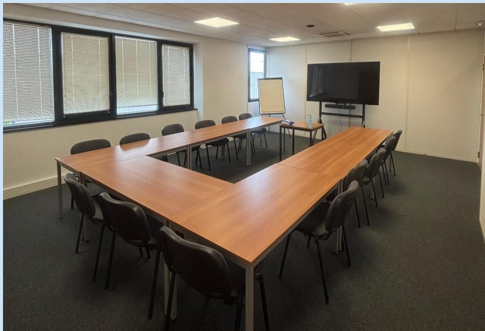
Salle de formation numéro 1

Il revient aux stagiaires d'apporter bloc-notes et stylo